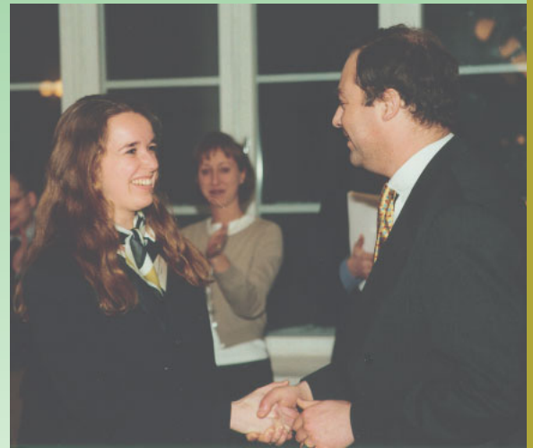
Parimaks advocate general' ics tunnustatud võistleja (Lundi ülikooli võistkonna liige).