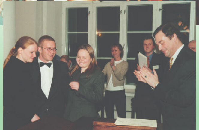
Regionaalfinaali võitnud Berliini võistkond.

Võistlusel osales üheksa võistkonda erinevatest Euroopa riikidest (Rootsi, Poola, Soome, Saksa, Taani, Prantsusmaa, Portugal, Ungari ja Inglismaa). Võitjaks tuli Berliini Ülikooli võistkond Saksamaalt.